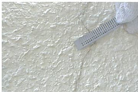
クラックスケールにて確認