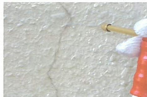
ひび割れ内部を高圧洗浄