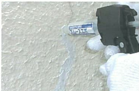
ハンドスムーサー使用注入作業