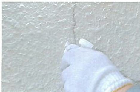
注入充填後、ふきとり清掃仕上げ