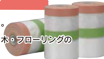
【巾木の養生での比較】