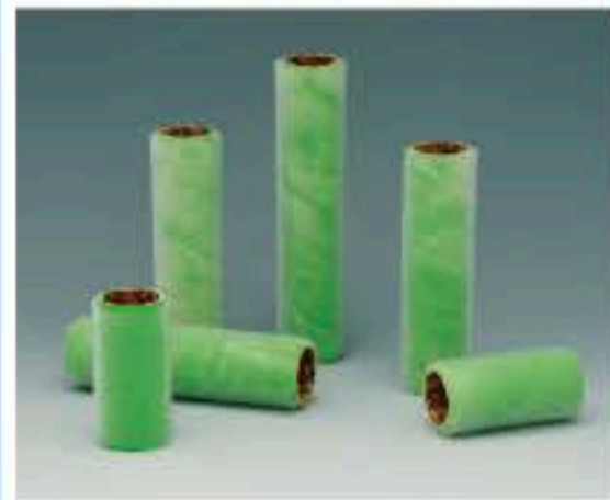
●レギュラー 短毛タイプの仕様