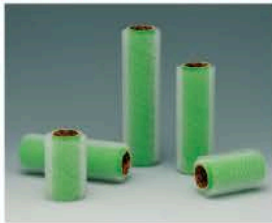
●レギュラー 中毛タイプの仕様