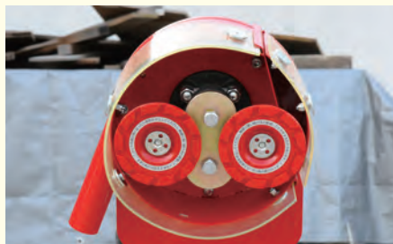
使用プレート:アートカップ取付プレート