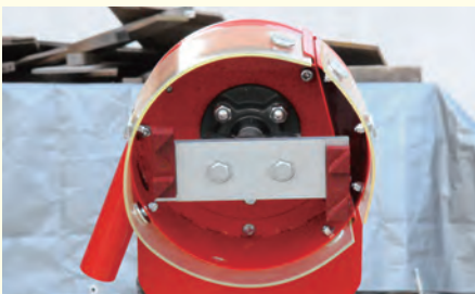
使用プレート:ベースプレート