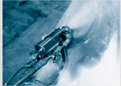
超速硬化ウレタン